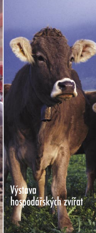
Výstava hospodářských zvířat