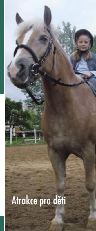
Atrakce pro děti