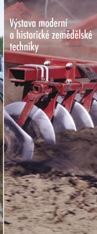
Výstava moderní a historické zemědělské techniky