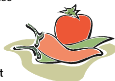
Porovnání dovozu plodové zeleniny do České republiky v roce 2004

Poznámka : Celní statistika zpětně provádí úpravu údajů o zboží dle celních deklarací. Pramen : ČSÚ