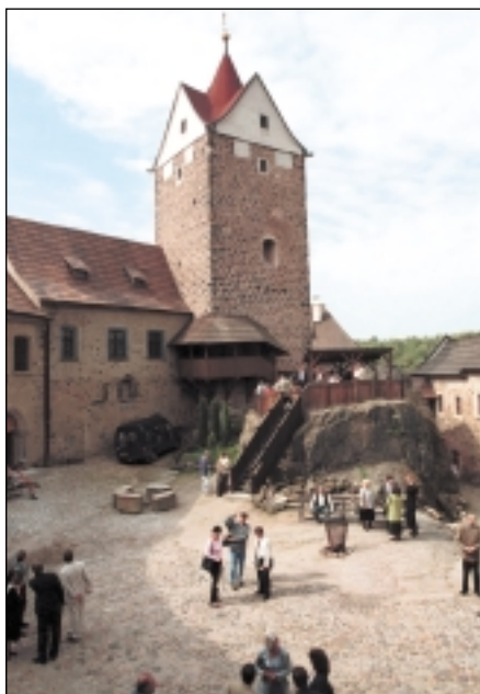
Zrekonstruovaný hrad Loket hostí řadu kulturních i vzdělávacích akcí

Z programu Phare CBC byly spolufinancovány i další projekty, například rekonstrukce klášterního kostela Nanebevzetí Panny Marie v Kladrubech u Stříbra (asi 11 mil. korun) či zámku Kynžvart (asi 30 mil. korun). Díky příspěvkům z programu Rafael dnes můžeme obdivovat obnovenou kapli na zámku ve Valticích či nástěnné malby na průčelí nového purkrabství na II. nádvoří zámku v Českém Krumlově. Také rekonstrukce Vysoké synagogy v Praze a její propojení s budovou radnice se uskutečnilo za podpory tohoto evropského programu.