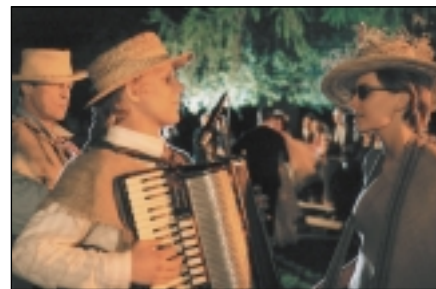
Na festivalu diváci uvidí i lotyšský film Mlýny osudu

Filmových a jiných audiovizuálních akcí, na nichž se s ČR bude podílet Evropská unie, by v budoucnu mohlo začít přibývat. Letos v lednu totiž zahájila v Praze činnost kancelář MEDIA Desk, která zastupuje podpůrné programy EU pro Česko. V rámci programů lze získat peníze na přípravu filmových a televizních děl, distribuci, kina, propagaci a další vzdělávání. Na výrobu filmů se program nevztahuje. (vak)