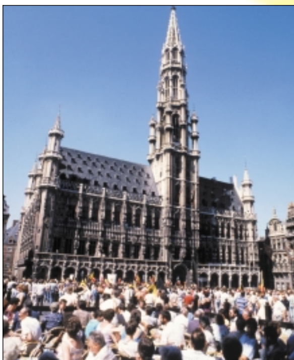
Prostranství před bruselskou radnicí na Grand Place je oblíbeným cílem turistů, ale rádi sem zajdou i obyvatelé hlavního města

Belgické království získalo svoji nezávislost až v roce 1830 po letech nejdříve římské a pak burgundské, španělské, rakouské, francouzské a holandské nadvlády. Možná i proto je Belgie zemí, kde se míchají jazyky i národy. Společně na třech desítkách tisících kilometrů čtverečních žijí tři komunity: na severu vlámská, mluvící holandsky, na jihu zní z úst Valonů francouzština a v neposlední řadě žije v Belgii i komunita hovořící německy. Belgie