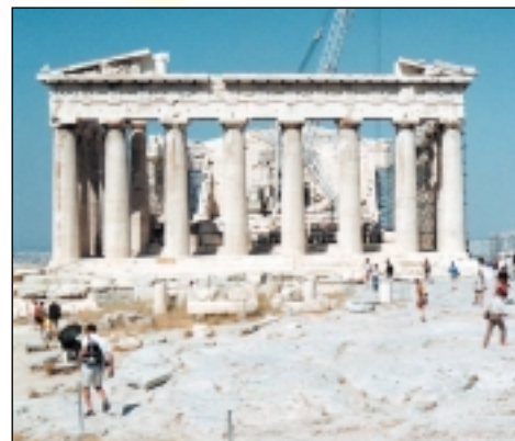
Němým svědkem podpisu smlouvy o přistoupení se stane athénský chrám Parthenón

Po uzavření jednání s EU v Kodani v prosinci loňského roku vše směřuje k dalšímu cíli – k podpisu smlouvy o přistoupení. Ten se uskuteční v dubnu na slavné Akropolis v Athénách. Proč zrovna v řeckém hlavním městě? Každého půl roku předsedá Evropské unii jedna z členských zemí a momentálně je jí právě Řecko. Proto bude hostitelem události, kdy deset nových zemí slavnostně uzavře s Unii smlouvu o přistoupení. Jejím podpisem ovšem celý proces nekončí. V přistupujících zemích se nejprve v referendech ke vstupu do EU vyjádří občané (v ČR to bude 15. a 16. června 2003). Pak musí smlouvu o přistoupení ratifikovat parlamenty přistupujících i členských zemí Unie a závěrečné hlasování pro-